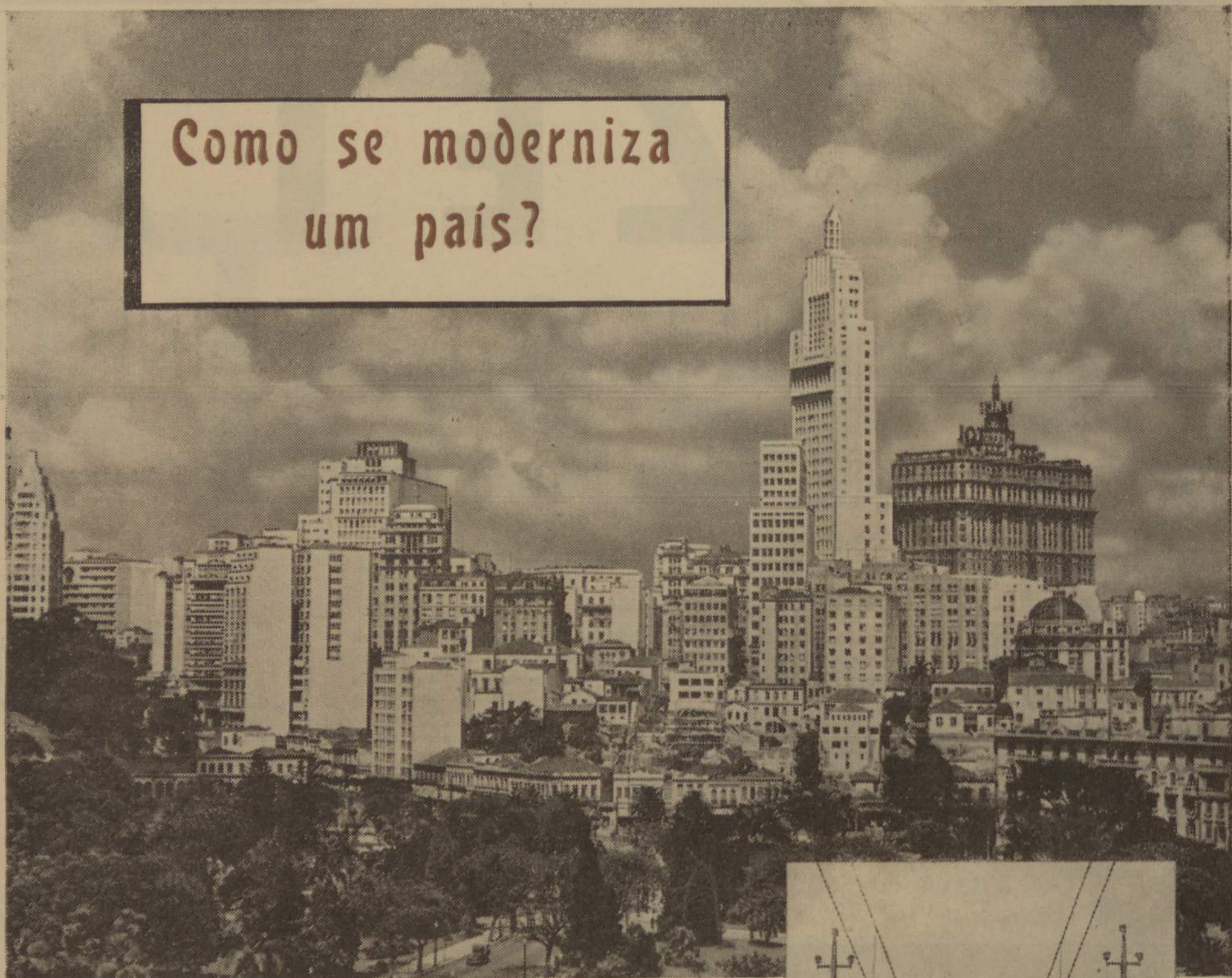
Fotografia autorizada pelo Governo Brasileiro

Como Engenheiros especializados em electrificação de caminho de ferro em todo o mundo, durante 35 anos, podemos dar uma ideia concreta sobre o aspecto fundamental desta questão. Cremos que o princípio essencial para modernização dum país é assegurar transportes rápidos, limpos, confortáveis e económicos. E para tal o que haverá melhor do que construir caminhos de ferro eléctricos ou electrificar as linhas existentes?