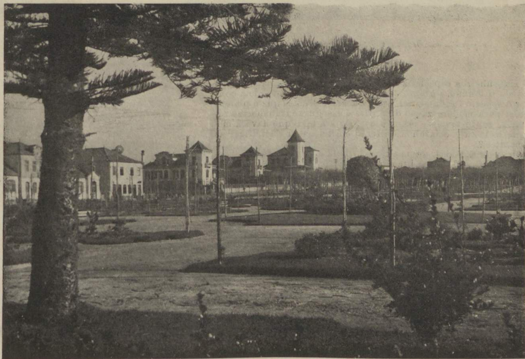
ESPINHO — Parque João de Deus

Rua da Horta Sêca, 7, 1.º Telefone P B X 20158 — LISBOA